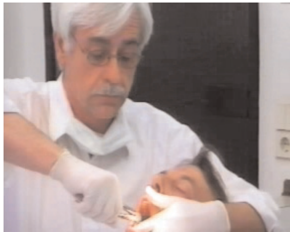
Die hypnotische Anästhesie wirkt in kürzester Zeit. Hier lässt sich Herr C. ruhig und gelassen drei Zähne „ohne Spritze“ entfernen.

Dass in Hypnose Wunderbares geleistet werden kann, ist im Grunde nichts Neues: Schon Kirchenvater Augustinus (354 - 430 n. Chr.) berichtet in „De civitate Dei“ von einem Priester, der einen Zustand der Bewusstlosigkeit erreichen konnte, in dem er gegen Kneifen und Nadelstiche schmerzunempfindlich, jedoch für die Unterhaltung voll aufnahmefähig war.